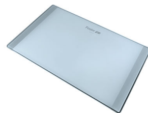
Tabla de corte de cristal 8633 300