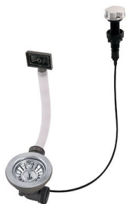
Desagüe automático 8407 100